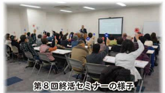
第8回終活セミナーの様子